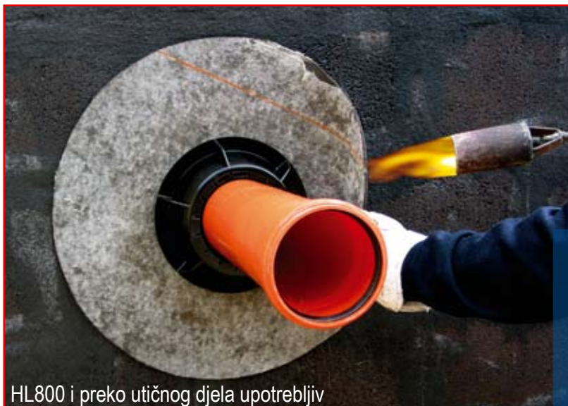
HL800 i preko utičnog dijela upotrebljiv

HL800 se jednostavno navuče preko cijevi, njegova bitumenska kragna se povezuje sa bitumenskom trakom ili premazom zidne hidro-izolacije. Masivne usne brtve od fleksibilne gume prekrivaju kanalnu cijev, tako se postiže 100% brtveni prelaz između cijevi i izolacije. Sprečava prodor oborinskih voda tako da podrumски zidovi ostaju pošteđeni nepoželjnih fleka. Posebno u vlažnim klimatskim zonama i kod objekata građenih na kosom terenu to postaje odlučujući kriterij za suhi podrum. HL800 je također preko utičnog dijela primjenjiv za plastične i ljevano željezne cijevi. Kroz prilagodljivu bitumensku kragnu HL800 je primjenjiv i na rubovima.